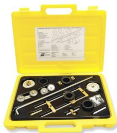
Sada vodících nástrojů Deluxe